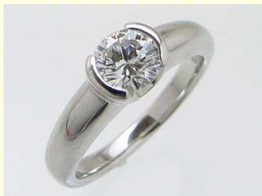
普段使いに 加工費 100,000 円～