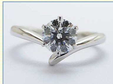
ひねりを加えて 加工費 70,000 円～