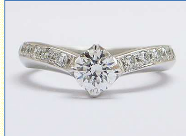
ダイヤをたして豪華に 加工費 100,000 円～