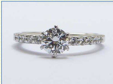
ダイヤをたして豪華に 加工費 100,000 円～