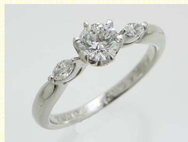
メレダイヤをたして 加工費 90,000 円～