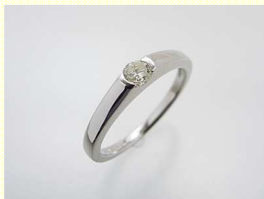
高さを抑えて使いやすく 加工費 80,000 円～