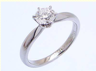
爪を小さくシンプルに 加工費 50,000 円～