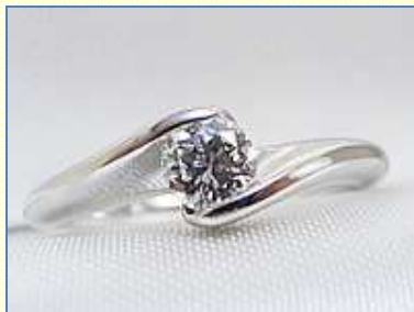
人気のデザインです 加工費 80,000 円～